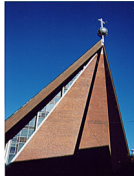
St. Michaelis - Kirche Doventorsteinweg 51