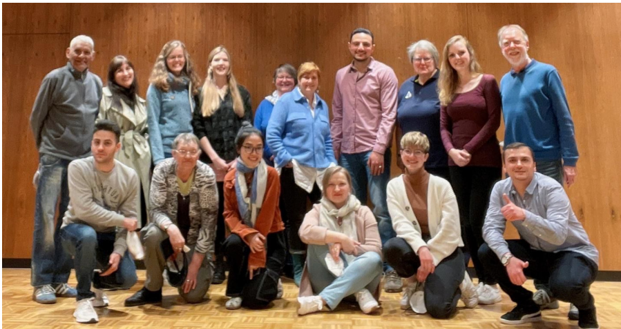
Das Team des Sonntagstreffs

Auch internationaler sind wir geworden. Sogar aus China, aus Shanghai, hat sich eine junge Studentin über die Freiwilligenagentur gemeldet. Ich habe nicht schlecht gestaunt, als ich eine E-Mail mit