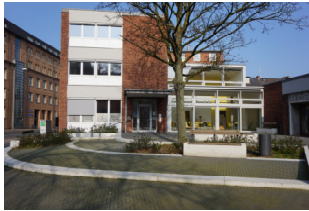
Gemeindebüro und Begegnungszentrum Doventorsteinweg 51, 28195 Bremen