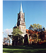
St. Stephani - Kirche Stephanikirchhof