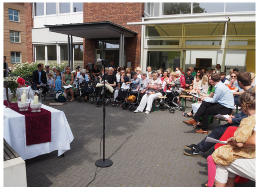
Pfingstgottesdienst auf dem Kirchplatz