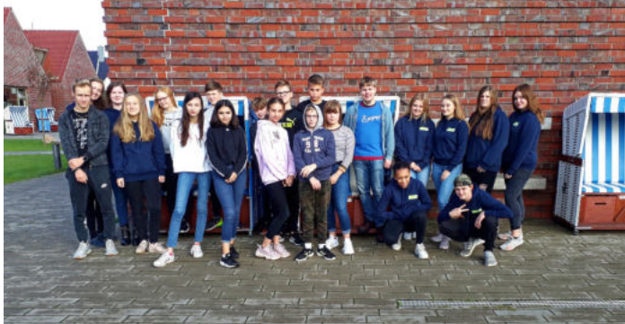
Gruppenbild auf Langeoog: die Konfis 2019/2020 mit dem Team

Den laufenden Konfi-Jahrgang begleite ich nun zum ersten Mal als Diakonin und bekomme dadurch einen neuen Überblick über die Gruppe und die Organisation von Konfus. Dieses Konfus-Modell bietet mir die Möglichkeit, gleichzeitig und gleichwertig Konfirmand*innen und Teamer*innen über ein Jahr lang zu begleiten: Ich nehme die Stärken und Interessen der Jugendlichen wahr und entwickle gemeinsam mit dem Team kreative Umsetzungsmöglichkeiten für entsprechende Konfus-Themen.