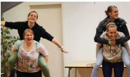
Eine groteske Theateraufführung des Teams beim Abschlussabend der Langeoog-Fahrt 2014

Knapp zwei Jahre nach meiner Konfirmation durfte ich das erste Mal mit als Teamerin nach Langeoog fahren und blieb danach im Hemelinger Konfus-Team. Diese Zeit war für mich noch intensiver: Statt nur Wissen und Ideen aufzunehmen, mitzuspielen und einfach dabei sein, konnte ich nun ausprobieren und mitgestalten. Anfangs habe ich mal hier und da Texte in Andachten gelesen, einzelne Spiele angeleitet und die Konfis auf Anwesenheitslisten abgehakt. Später reflektierte ich mit dem Team durchgeführte Aktionen, hörte ich mir abends auf Langeoog die Sorgen von Konfis oder jüngeren Teamer*innen an und leitete Kleingruppen. Und bei all dem hatte ich mit den immer wechselnden Konfis und dem Team viel Spaß und habe mich in der Gruppe immer sehr wohl gefühlt.