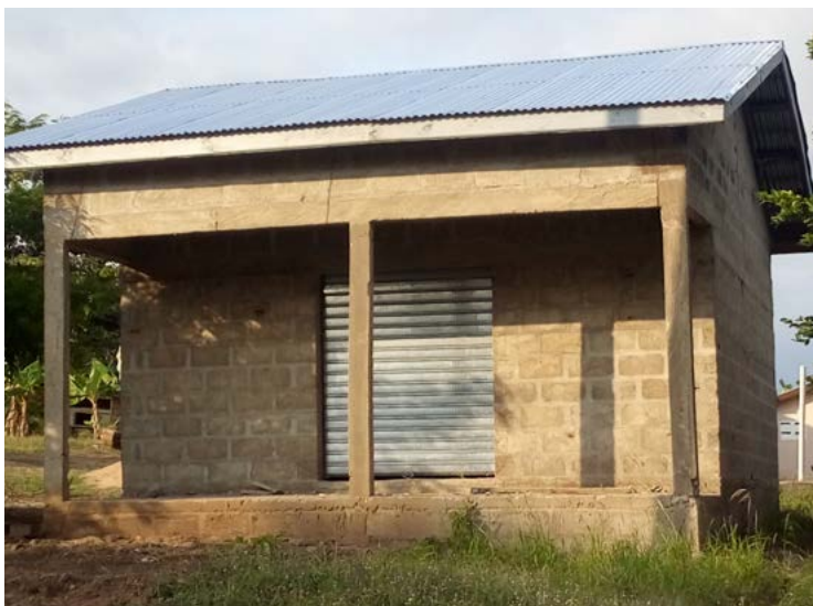
Der Shop an der Straße nach Togo ist fast fertig gestellt!

P.S. Für Interessierte: Das geplante Treffen am Mittwoch, den 09.12.2020, um 19 Uhr in der Jona-Gemeinde in