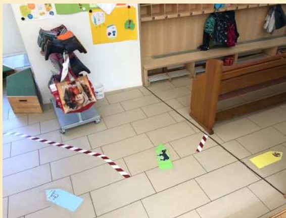
Markierte Wege führen in die Gruppenräume