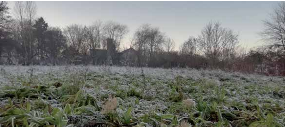
Wildblumenwiese im Winter mit Blick auf Gemeinde- und Kindergartengelände

Die Kita-Anmeldung für das Jahr 2022/23 ist nur unter folgender Adresse möglich: kitaportal.bremen.de