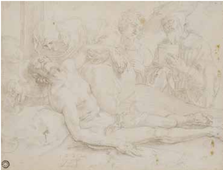
Albrecht Dürer, Beweinung Christi, 1522, Inv.-Nr. 1851/3 Z

Dürer hat dieses Passionsmotiv auch noch anderweitig bildnerisch umgesetzt, und zwar einzeln sowohl in Form von Gemälden (Abb. S. 4) auf Wunsch Nürnberger Freunde, als auch, in späteren Jahren wohl, zeichnerisch (Abb. unten). Offenbar lag ihm und diesen Freunden daran, sich dem Gekreuzigten zwischen Kreuzestod und Begräbnis noch einmal auf andere Weise zu nähern als durch die verwandten und gängigeren Andachtsbildmotive Kreuzabnahme, Schmerzensmann, Pietà oder Grablegung, nämlich in mitfühlender Betrachtung quasi noch am Ort des schockierenden Geschehens und zugleich aber auch schon in der ruhigeren Bewegtheit trauernder Anteilnahme, und dies im erweiterbaren Kreis von Betroffenen.