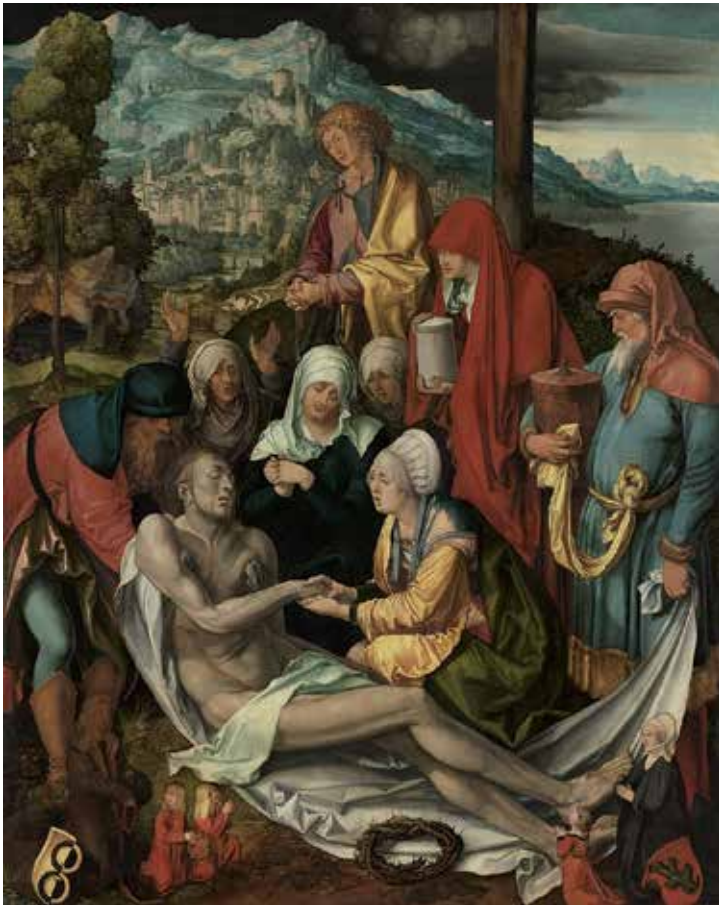
Albrecht Dürer, Beweinung Christi („Glimsche Beweinung“), um 1500, Bayerische Staatsgemäldesammlungen - Alte Pinakothek, München

biblischen Überlieferung rund um Kreuz und Auferstehung Jesu mit seiner künstlerischen Gestaltung folgt. Besonders bemerkenswert erscheint mir dabei eine Szene, die im Neuen Testament allenfalls angedeutet ist (in Mt 27,55-61, Mk 15,40-47 und Lk 23,49-56), nämlich die sogenannte Beweinung Christi, zu der sich mehrere Frauen, wohl Jesu Mutter Maria (wegen Joh 19,25-27) mit Maria von Magdala und anderen, sowie drei Männer, und zwar Johannes, Josef von Arimathäa und Nikodemus (er in Joh 19,39), um den vom Kreuz gelösten Leichnam Jesu versammeln.