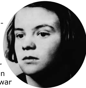
Sophie Scholl (undatiertes Archivfoto)