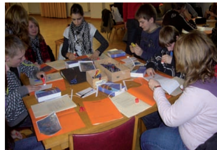
„Die Konfis beim Konfus-Samstag „Jesus Christus“ bei der Bearbeitung der sog. „Jesus-Pässe“