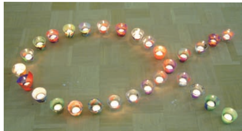
Der Konfus-Samstag mit dem schwierigen Thema Tod und Leben am 22.11.08 endete mit der Gestaltung von Hoffungslichtern, die wir in Form des alten christlichen Fisch-Symbols angeordnet haben.