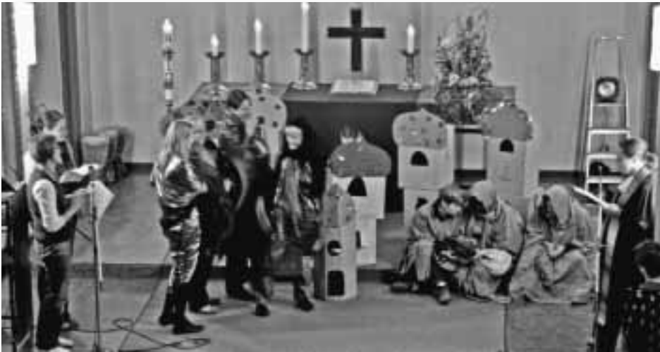
„Jona, der Wal und Ninive“ – ein schöner Gottesdienst