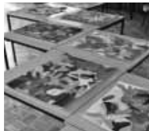
Kunstwerke mit Schablonen-Technik