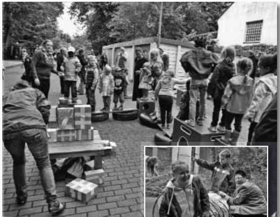
Hier ist Geschicklichkeit gefragt