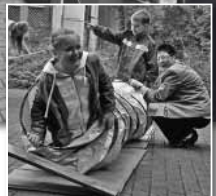
Geschafft! – Ich bin durch