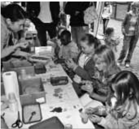
Ene mene miste es rasselt in der Kiste