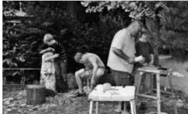
Bei der Arbeit....

der drei Gemeinden in der St. Georgs-Gemeinde