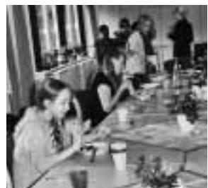
In den Pausen