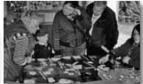
Buttons - welchen nehme ich nur?