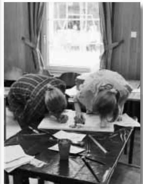
Höchste Konzentration beim Malen