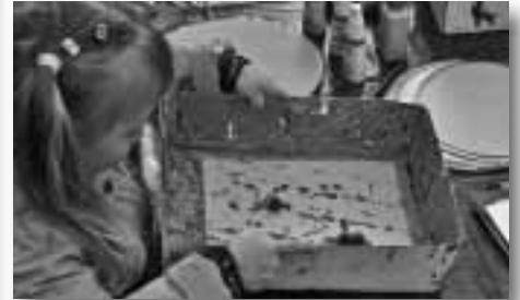
Farben, Kugeln und Bewegung werden zur Murmelkunst