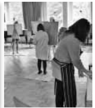
Malerei in allen Variationen