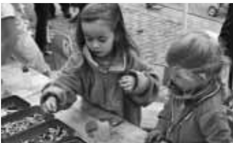
Ich möchte auch eine Kette