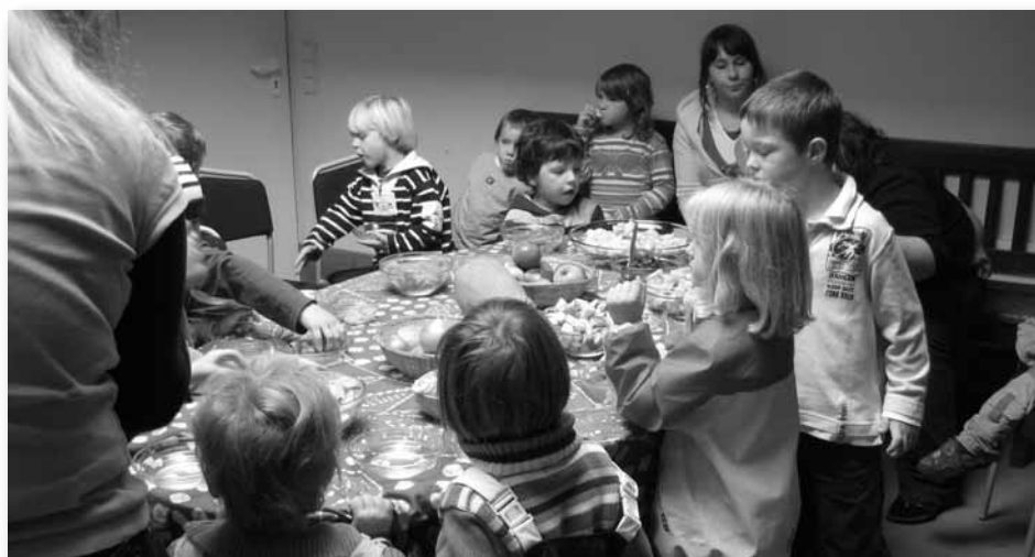
Hier wird alles einmal probiert.

Da Kinder verschiedenster Nationalität und Konfession unsere Einrichtung besuchen, sind wir bestrebt, diese Kinderkirche so zu gestalten, dass sich jedes einzelne Kind darin wiederfinden kann.