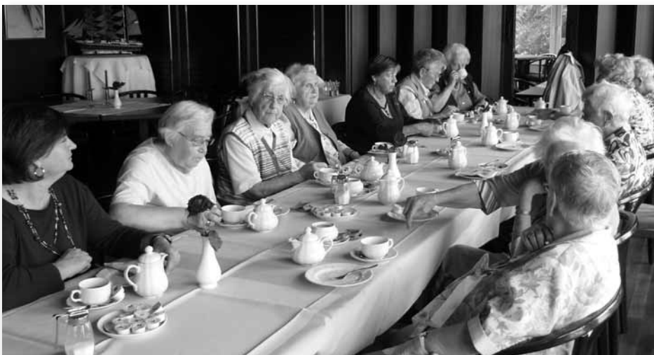
Kaffeepause für die Damen im Lankener Höft

Am 10. September startete der Altenkreis zu seinem Herbstausflug. Über den Wardamm ging es zur Überseestadt: Viele Damen haben das erste Mal die neue Autobahn gesehen. Mit dem Kleinbus fuhren wir kreuz und quer durch die neu gestaltete Überseestadt. Leider konnten wir nicht durch alle geplanten Straßen fahren, da die Baustellen sich dort tagtäglich ändern?! Die Kaffeepause genossen wir im Lankener Höft auf der anderen Seite der Weser.