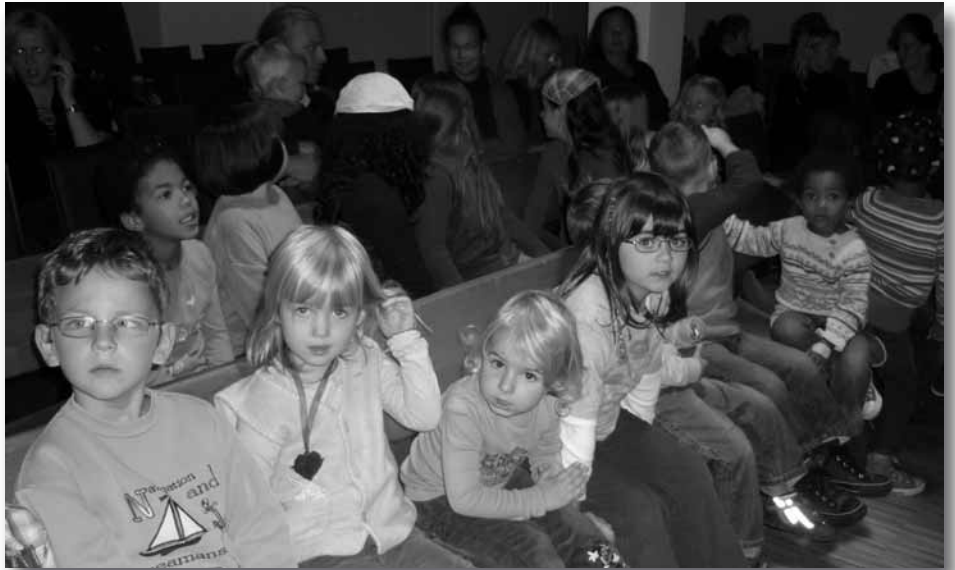
Unsere Kinder bei „Mama Muh“