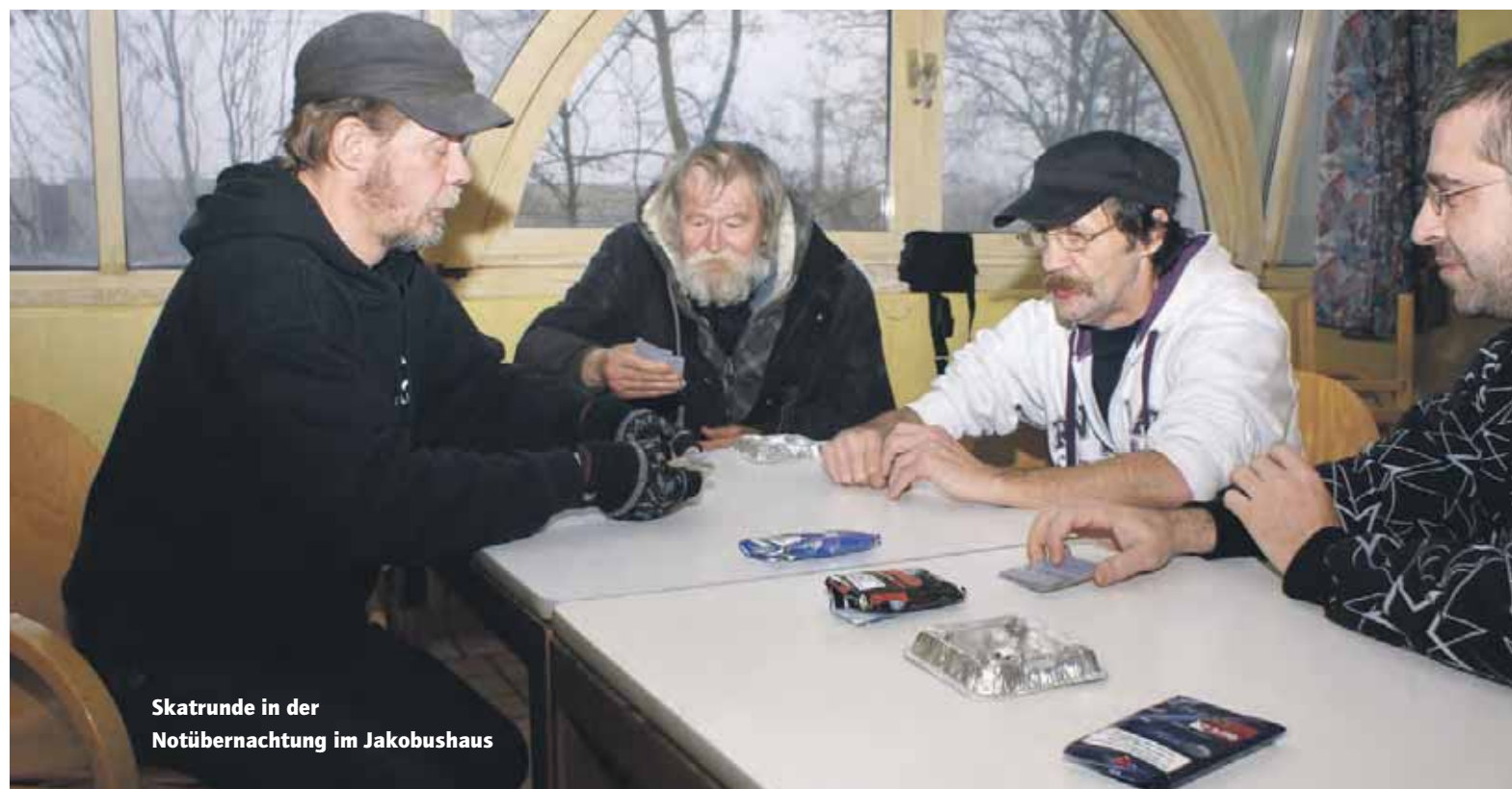
Skatrunde in der Notübernachtung im Jakobushaus