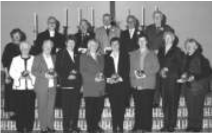
goldene / diamantene Konfirmation 2010

Als Gemeinde haben wir zwar die Konfirmationsregister der 50er