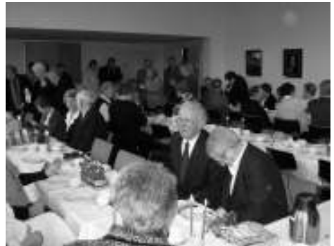
goldene / diamanten Konfirmation 2010

Wir möchten einen festlichen Gottesdienst gestalten, in dem die Jubilare sich erneut dem Segen Gottes unterstellen. Im Anschluss an den Gottesdienst ist ein gemütliches Beisammensein mit Kaffee