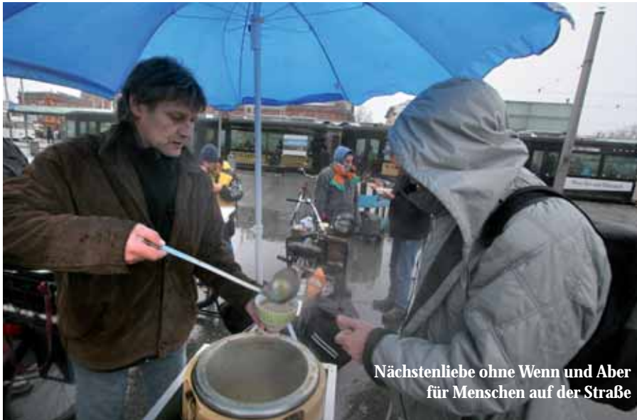
Nächstenliebe ohne Wenn und Aber für Menschen auf der Straße