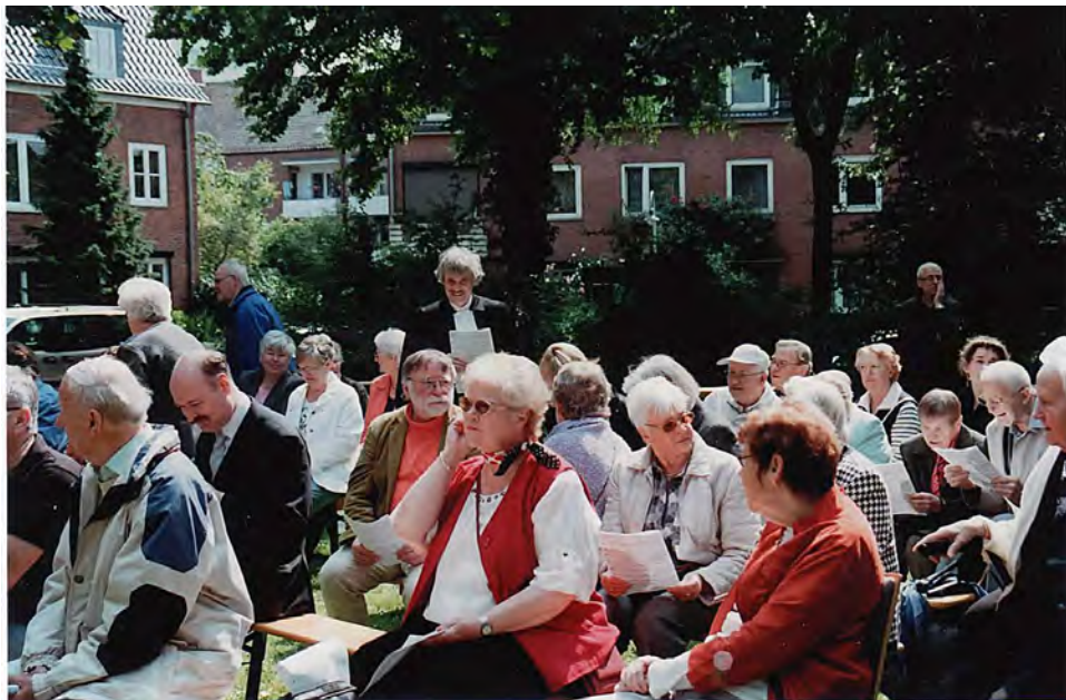
Gemeinsamer Pfingstgottesdienst der Gemeinden des Bremer Westens auf der Kirchwiese von St. Stephani

Wir freuen uns über Ihre Erntegaben für den Erntedankgottesdienst. Bitte geben Sie Blumen, Obst oder Gemüse bis Freitagmittag (30.9.) im Gemeindehaus St. Michaelis ab. Vielen Dank!