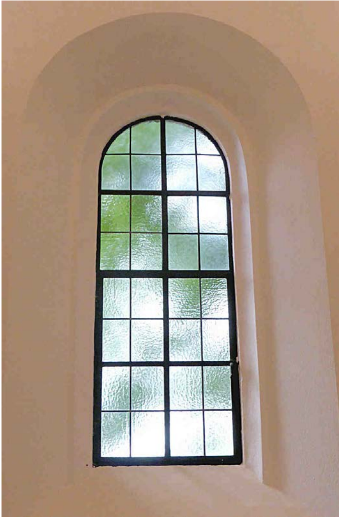
Fenster im Seitenschiff