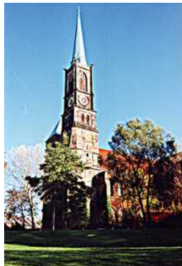
St. Stephani Stephanikirchhof