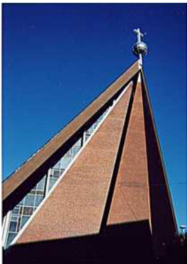
St. Michaelis Doventorsteinweg 51