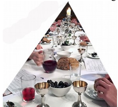
Tischabendmahl am Gründonnerstag