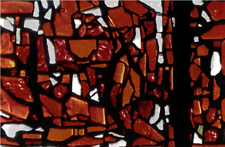
Fensterbild in der St. Michaelis-Kirche