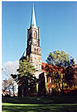
St. Stephani Stephanikirchhof