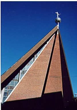
St. Michaelis Doventorsteinweg 51