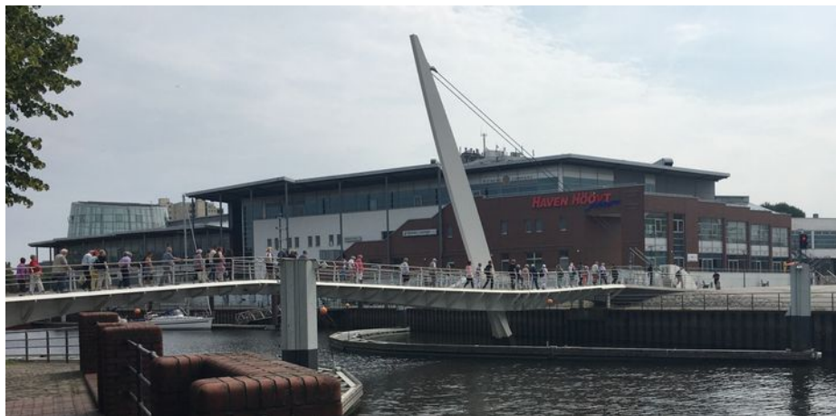
Ausflug der Ehrenamtlichen

Vielen Dank für Ihre Unterstützung für Bethel!