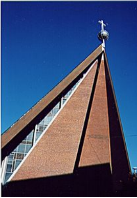
St. Michaelis Doventorsteinweg 51