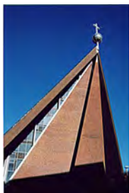
St. Michaelis Doventorsteinweg 51