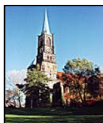
St. Stephani - Kirche Stephanikirchhof