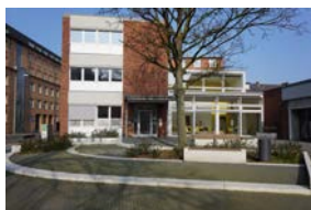
Gemeindebüro und Begegnungszentrum Doventorsteinweg 51, 28195 Bremen