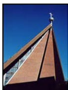
St. Michaelis - Kirche Doventorsteinweg 51