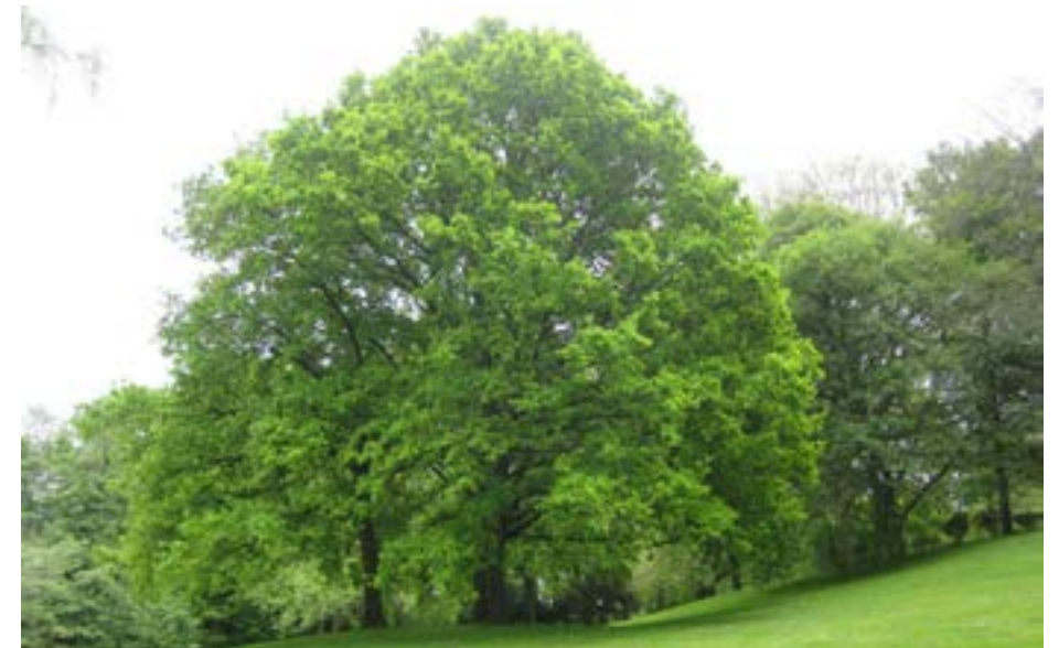
Die Bäume stehen voller Laub, das Erdreich deckt seinen Staub mit einem grünen Kleide ...