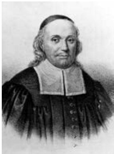
Kupferstich Paul Gerhardt (1607–1676), lutherischer Theologe und Dichter. 17. Jahrhundert; aus der Bildersammlung des evangelischen Predigerseminars in der Lutherstadt Wittenberg

Paul Gerhardt ist ein Phänomen: Noch 350 Jahre nach seinem Tod spenden seine Liedtexte vielen Menschen Kraft und Orientierung für ihr eigenes Leben. Nicht umsonst zählen seine Lieder neben Grimms Märchen und Luthers Bibelübersetzung zu den bekanntesten deutschen Texten. 26 Lieder sind von Paul Gerhardt im Stammtitel des Evangelischen Gesangbuchs vertreten. Auch das katholische Gesangbuch „Gotteslob“ enthält fünf Lieder.