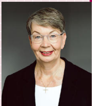
Landesbischöfin Kristina Kühnbaum-Schmidt Landesbischöfin der Evangelisch-Lutherischen Kirche in Norddeutschland und EKD-Schöpfungsbeauftragte